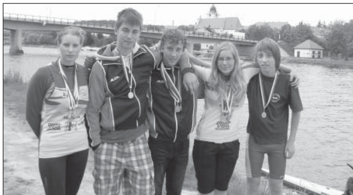
Medailisté z 2. závodu českého poháru v Sedlčanech.