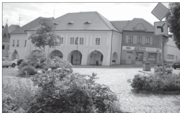
Splacením hypotečního úvěru by se město zbavilo závazku ručení budovou radnice a dalšími pozemky.

prostředků na účtu města otevírá a splatit ho najednou. Prostředky možností se s úvěrem vypořádat uložené na účtu vzhledem k ní-