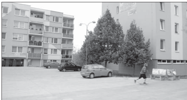
Bude na náměstí Mládeže klidová zóna?