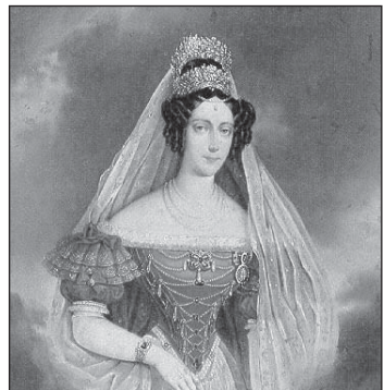
Marie Anna Savojská.

Pět let po sňatku zavítal manželský pár do Prahy, aby tady předvedl svým poddaným poslední velkolepé divadlo – královskou korunovaci. Čeští stavové se na tuto událost náležitě připravili a přichystali Národní korunovační slavnost, jakou Čechy ještě nezažily. Týden po Ferdinandově korunovaci (dva dni po korunovaci jeho manželky), 14. září 1836, se na rozlehlém prostranství za Invalidovnou rozeběhla tzv. Česká svatba, na níž bylo vedle hlavního města Prahy zastoupeno všech 16 tehdejších českých krajů. Slavnost začala průvodem, v jehož čele šli zástupci Prahy a za nimi abecedně seřazeny jednotlivé kraje.