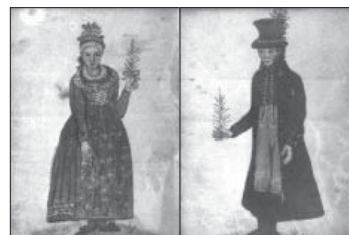
Nevěsta a ženich - obrázek ze sbírek bechyňského muzea.