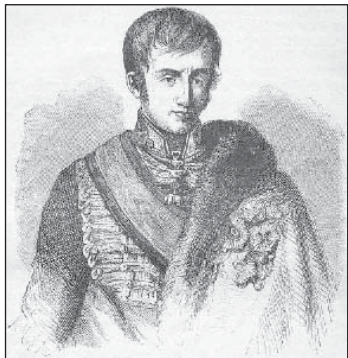
Ferdinand I. Dobrotivý.

nezpůsobilo a zpočátku mu bylo odpíráno i následnictví trůnu. Z velké části jistě za Ferdinandovo postižení mohla genetika, neboť jeho rodiče byli bratranec a sestřenice, tedy Ferdinandovi prarodiče byli vlastními sourozenci. Ferdinand I. ovšem nakonec všechny překvapil. Jeho vychovatelé zjistili, že má vynikající paměť. Naučil se hovořit pět jazyků (po císařovně Marii Terezii byl kupříkladu poslední, kdo při korunovaci uherským králem hovořil maďarsky). Byl také hudebně nadaný, hrál na klavír a trubku, zajímala ho botanika a zajímal se o vývoj techniky. Prohlášení o jeho nesvéprávnosti bylo tedy revokováno a v roce 1830 byl Ferdinand korunován uherským králem. Následujícího roku se oženil s Marií Annou Savojskou. Sňatek proběhl v zastoupení, takže nevěsta svého manžela spatřila až o patnáct dní později a údajně přitom zažila šok. Sama nebyla podle dobových kritérií krásná (ovšem jaký byl tehdejší ideál krásy...), měla široká ramena a vysoké čelo, ale vzezření jejího manžela ji zaskočilo. Navzdory tomu mu byla po celý následující (a oproti předpovědím lékařů i dlouhý) život věrnou družkou a spíše než manželkou – ošetrovatelkou. Manželství bylo bezdětné. Navzdory prognózám se Ferdinand I. dožil pozehaného věku 82 let, zemřel v roce 1875 na Pražském hradě, milován všemi Pražany, kteří jej měli ve velké oblibě. Jeho manželka jej o devět let přežila, zemřela rov-