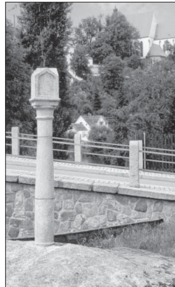
Boží muka Na balvaně v Bechyni

Poslední boží muka jsou opět mladší, barokního původu, zato však velmi zajímavá. Nacházejí se v bechyňské čtvrti Zářečí, podle svého umístění přímo na žulové skále jsou nazývána Na Balvaně a jsou