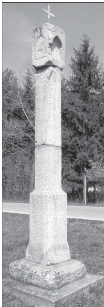
Boží muka Hodonice

Martina Sudová Pramen: Zdenka Paloušová, Kamenná boží muka v jižních Čechách a přilehlé Moravě, NPU České Budějovice, 2009