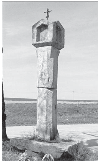
Boží muka Březnice