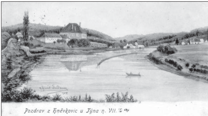
Hněvkovice na kreslené pohlednici Ignáce Lindauera.

V 11. čísle Vltavínu v loňském roce jsme informovali čtenáře o dosud neobjasněném původu vzniku zajímavých kreslených pohlednic Týna nad Vltavou a okolí, pod nimiž je jako autor podepsán Ignát (či Ignác nebo český Hynek) Lindauer. Soubor pohlednic, včetně jejich kreslených předloh, které jsou ve sbírkách městského muzea, pochází z počátku 20. století, konkrétně z let 1904 – 1906. Vyslovili jsme domněnku, že by mohl Ignát Lindauer pocházet z plzeňské umělecké rodiny, z níž se proslavil zejména Bohumír Lindauer, působící na Novém Zélandu. Bohužel, u jména malíře Ignáce Lindauera, bratra Bohumíra Lindauera, uvedeného ve Slovníku výtvarných umělců, bylo zapsáno datum úmrtí 2. 5. 1888 v Neratovicích a nemohl být tedy „naším“ Lindauerem, působícím na Vltavotýnsku na počátku 20. století. Při hledání informací jsem rovněž narazila na zmínku o tom, že matka kardinála Josefa Berana se za svobodna jmenovala Lindauerová. Vzhledem k tomu, že Lindauer je neobvyklé příjmení, domnívala jsem se, že by rovněž mohlo jít o příbuzenský vztah. Bohužel, v archivu v Plasích, kam jsem se obrátila, neboť je zde uložena písemná pozůstalost kardinála Berana, bližší informace k rodině Lindauerových nebyly.