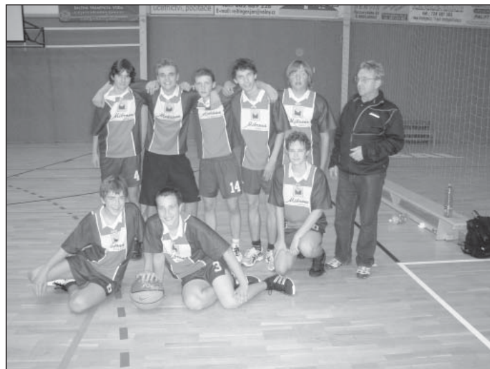
Bronzové družstvo basketbalistů

Týnské gymnázium navštěvuje denně 230 studentů. Mnozí z nich se účastní řady vědomostních nebo sportovních soutěží a olympiád a dosahují v nich chválných výsledků. Hned na začátku školního roku obsadil tým chlapců 3. místo v okresním finále basketbalového turnaje a na 3. příčce se umístilo i družstvo chlapců v regionálním finále Středoškolské futsalové ligy.