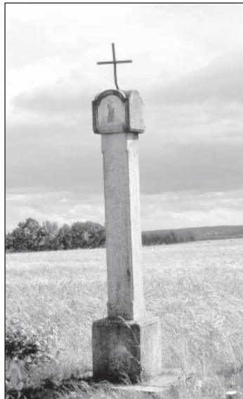
Boží muka Dolní Bukovsko

Další kamenné památky se pak nacházejí nedaleko našeho města, na okrese Tábor, zejména v Bechyni a jejím blízkém okolí. Milovníci cykloturistiky a turistky se s nimi již určitě setkali. Vznikaly vesměs kolem roku 1500, kdy vlastnili bechyňské panství Sternberkové, a mohou souviset s přestavbou bechyňského františkánského kláštera. První z nich najdeme v obci Březnice. Boží muka jsou situována vlevo od hlavní silnice, na rozcestí s místní komunikací, a jsou dobře viditelná i řidičům, jedoucím tudy do Tábora. Jsou zajímavá především tím, že mají velice málo opracovaný pilířek z rostlého kamene. Na jeho vrcholu spočívá čtyřboká mohutnější kaplice se čtyřmi trojúhelně zakončenými nikami (původně pro umístění svatých obrázků, dnes bez