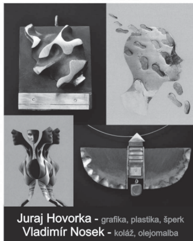
Juraj Hovorka - grafika, plastika, šperk Vladimír Nosek - koláž, olejomalba

Otevírací doba: Úterý - pátek 13.00 - 16.00 hodin, sobota 9.00 - 11.00 hodin, neděle 14.00 - 16.00 /mimo uvedené hodiny po dohodě na tel. 604 207 826/ www.tnv.cz, marie.hanusova@tnv.cz